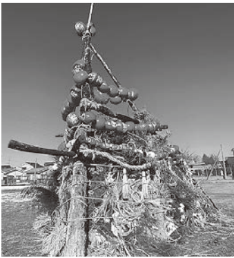
点火されず解体・撤去された三九郎

横田第1町会の小学生と保護者、子ども会役員さんが三角公園に集合し、数班に分散して玄関先に置かれたダルマや松飾り、しめ縄などを見落とさないように注意しながら町内を回り収集場所に運びました。三九郎開催場所の横田グラウンドには、育成会長さんが車で一気に運搬してくださり、松集めを終えた子ども