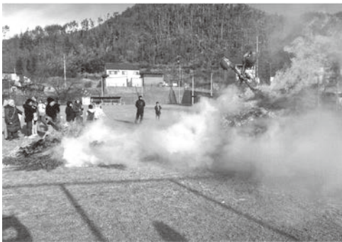
延期して実施された稲倉の三九郎

発表中は、たき火等の火の使用が制限される。林野火災注意報は罰則なしの努力義務だが、火災警報は違反すると30万円以下の罰金又は拘留の罰則が消防法で定められている。(松本市ホームページより)