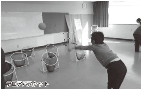
フロアバスケット

1月31日(土)に本郷公民館にて室内レクリエーションスポーツ体験会が行われました。ゲートボールのようなスティックでボールを打ち、点数の書かれた穴へと落とすスカットボール、マジックテープのついたダーツやボールを的に投げるソフトダーツ、床に設置したゴールにボールを投げ入れるフロアバスケット 当日は小学生を中心に約20名が競技サポーターの方から指導を受けながらゲームを楽しみました。(浅間6 T)