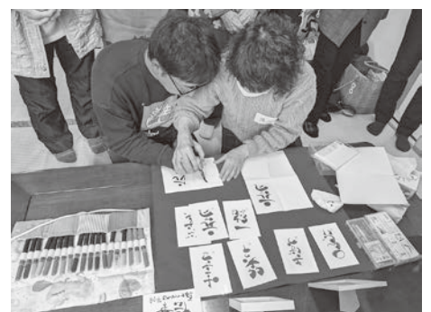
講師の指導で絵手紙を作る参加者

できないので、貴重な機会となりました。会の後半では講師の指導による「絵手紙の実習講演会」がありました。自分の書きたい言葉を絵手紙に込めて表す体験を通して、絵手紙の楽しさや面白さを味わうことができました。実演する人も見守る人も大いに盛り上がり、新しい楽しみを発見することができました。(浅間8 K)