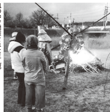
風の中で開催された三九郎

焼いた繭玉をフーフーしながらおいしそうに食べていました。強風と寒さの中で活躍された役員と消防の方々大変お疲れさまでした。(浅間6 T)