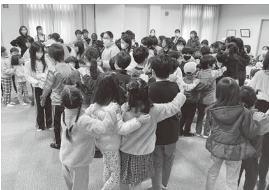
じゃんけん列車を楽しむ子どもたち

新1年生には黄色いカサを贈られ、「安心して学校に通ってね」と声をかけられていました。ビンゴ大会やじゃんけん列車などのレクリエーションも行われ、楽しそうな声が響いていました。(物社 F)