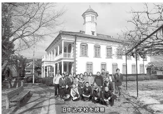
旧中込学校を視察