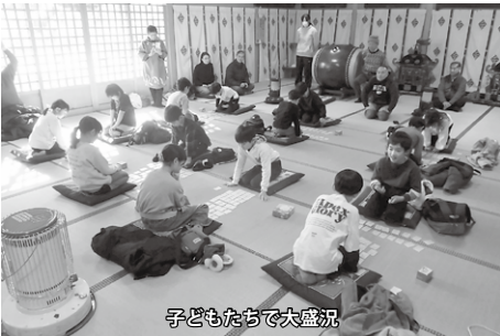
子どもたちで大盛況

正月の風物詩、百人一首を、地域で楽しんで世代間の交流を深めようと開催された大会は、競技かるた形式で、100枚の取り札の内、50枚をランダムで選び、それを2人で取り合い勝敗を決める方法で行われました。