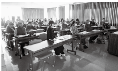
▲最近の松本城から目が離せません。

その後、茶話会が開かれ、活発な質疑応答がありました。 全体で約2時間の講演会でしたが、わかりやすい資料と説明で濃密な時間を過ごすことができました。