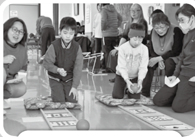
1/25 軽スポーツ交流会