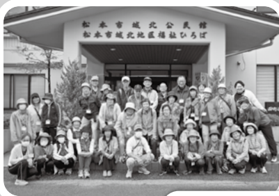
5/10 春のウォーキング大会