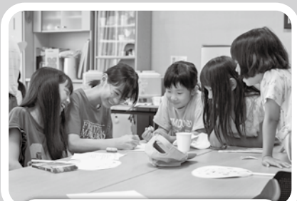
8/1~2 公民館に泊まって遊ぼう