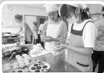
7/29 手づくりパンとスイーツ講座