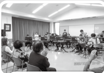
10/18 ファミリーコンサート