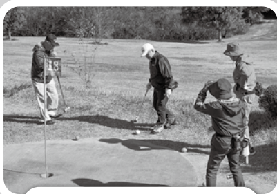
11/8 マレットゴルフ大会