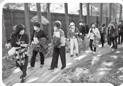
11/17 木曽町の文化を訪ねる