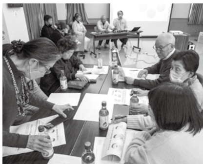
▲グループ毎真剣に話し合う参加者

令和の日本は5人に1人が認知症と言われています。若年性認知症と診断された3名の方が長野県内からお見えくださり、貴重な体験や現在の心境・状態などを話してくださいました。 「物忘れ」だけではなく視覚・聴覚・触覚に変化をもたらす記憶と感覚変化の脳の病気であります。見えている世界、聞こえている世界が違いパニックにもなりますが、不安なので確認したいだけなのです。病気とみるのではなく、「その人」