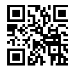
ハレホレ 松薪割り報告