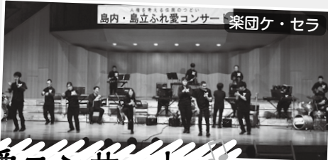
島内・島立ふれ愛コンサート 楽団ケ・セラ