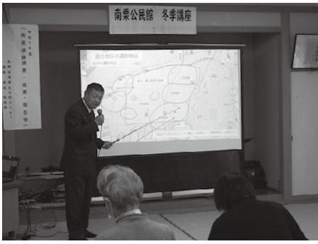
南栗公民館冬季講座の様子

この調査は、中部縦貫自動車道の建設工事に伴うもので、南栗地籍の栗林神社周辺で実施されており、今年度で5年目になります。その結果、とても興味深いことがいくつ分かかってきました。 一つは、奈良時代から平安時代まで数百年間にわたる生活の跡が同じ場所で確認され