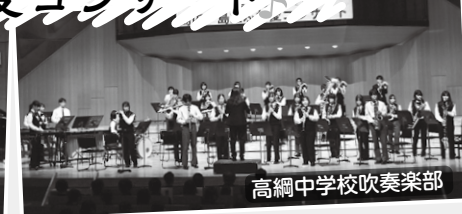
高綱中学校吹奏楽部