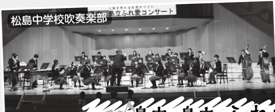
松島中学校吹奏楽部

は次第に大きくなりました。続いて、松島中学校・高綱中学校吹奏楽部による演奏が続きました。若い力あふれる音色に会場は引き込まれ、最後は両校に島立小学校の有志が加わった3校合同の「宝島」の息の合った力強い演奏は、会場に大きな感動を届けました。