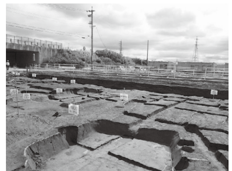
南栗遺跡の発掘現場 (住居跡)

たことです。そして、もう一つは、松本盆地で最大級の古代集落が確認されたことです。堅穴建物跡や掘立柱建物跡等の建物跡が、600軒以上発見され、ここに古代集落があったことを裏付けています。つまり、南栗周辺は、昔からかなり多くの人々が、長期間にわたって住んでいた場所であるという事です。