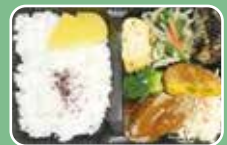
ハンバーグ&かぼちゃコロッケ