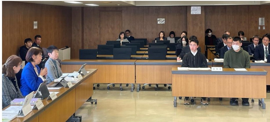
委員からの質疑に答える様子

1年時から交流をはじめ、2年時には議員とフィールドワークを行い、その中で、生徒たちは本請願へのヒントを得ました。