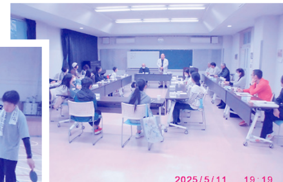
第1回子ども会会議 5/11