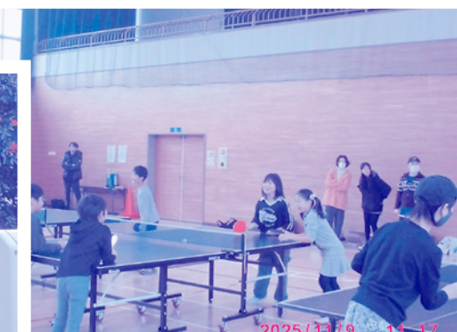
子ども会独自事業 11/9