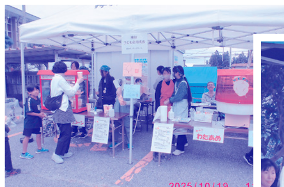
神林ふれあい文化祭 10/19