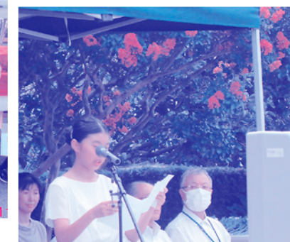
子ども会独自事業 11/9