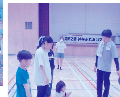
わくわく子ども広場 (ニュースポーツ) 6/29