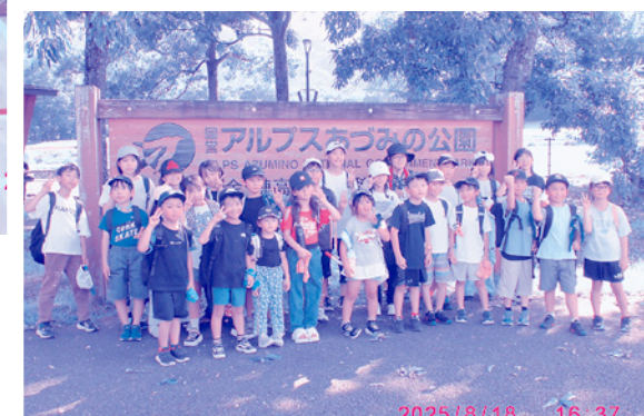
夏休みわくわく子ども広場(あづみ野公園) 8/18