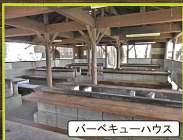
バーベキューハウス