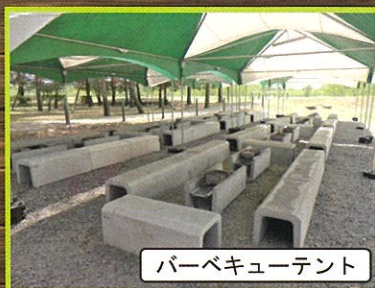
バーベキューテント