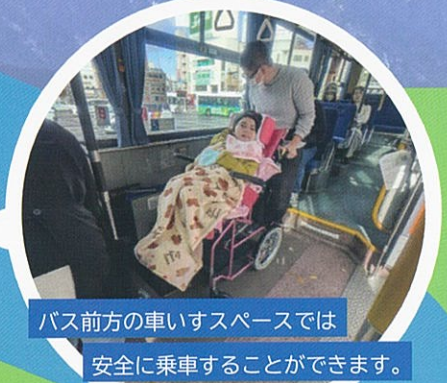
バス前方の車いすスペースでは安全に乗車することができます。