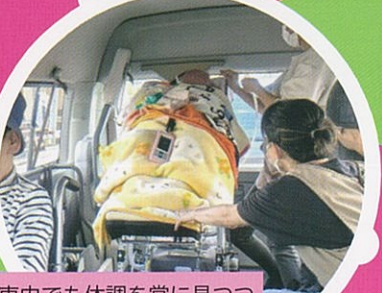
車内でも体調を常に見つつ松本城へ向かいます。