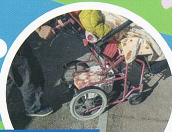
ちょっとした段差を無事越えました。