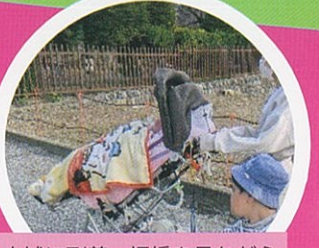
松本城に到着。埋橋を見ながら天守閣へ向かいます。