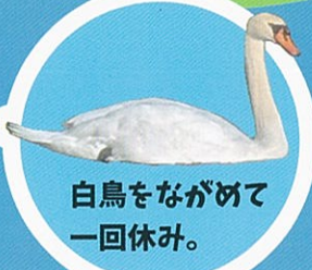
白鳥をながめて一回休み。