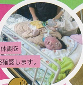
知世さんの体調を最終確認します。