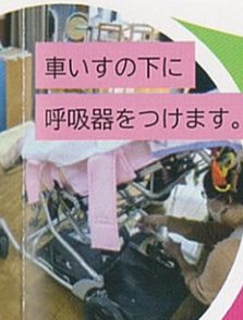
車いすの下に呼吸器をつけます。