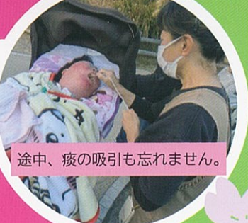
途中、痰の吸引も忘れません。