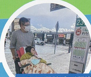
もうすぐ路線バスが到着。初めての乗車にワクワク!