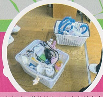
お出かけの荷物はたくさんありますが、どれも必需品。忘れ物のないようにチェックを欠かしません。