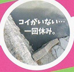
コイがない...一回休み。