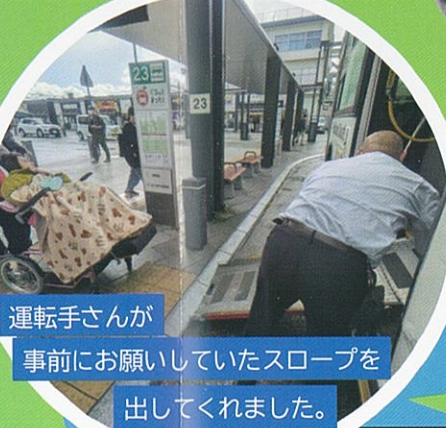
運転手さんが事前をお願いしていたスロープを出してくれました。