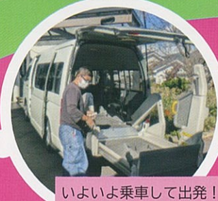
いよいよ乗車して出発!