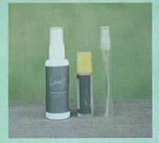
アロマオイルを使ったWS