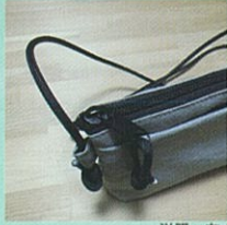
洋服・布小物 サコッシュ作成WS

屋外にはキッチンカーなど 食べ物を販売するお店が 出店します。天気が良ければ テントとテーブルと椅子も 屋外に設置します。 ゴミは各自持ち帰りに ご協力をお願いします