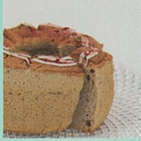
オリジナルスイーツ・紅茶 オーガニックコーヒー・ハーブティ