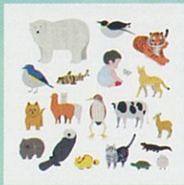
オリジナルイラストのグッズ