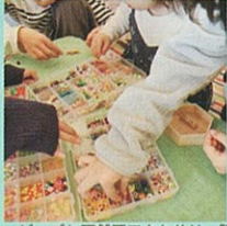
ビーズと天然石アクセサリー販売 プレスレットとキーホルダーWS