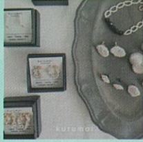
アクセサリー・キッズ服