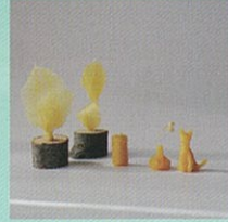
蜜蝋(みつろう)キャンドルWS