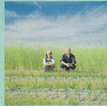
野菜販売(自然野菜)