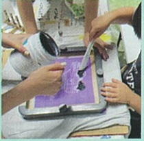
シルクスクリーンWS