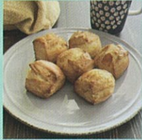
信州産食材を使ったスコーン 焼き菓子

制作体験の出来る ワークショップもあります！ お子さんから大人の方まで 皆さん楽しんで頂ける 内容となっています。