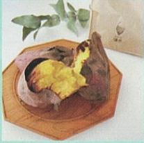
焼き芋・おもいチップス