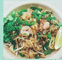
エビパッタイ 厚揚げとうふパッタイ