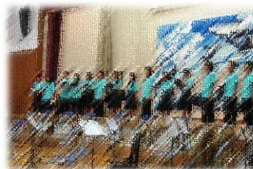
ステージ発表（合唱部）