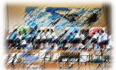
ステージ発表（美術部）