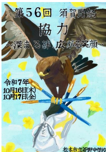
ポスター最優秀作品

本年度は「協力 ~深まる絆 広がる笑顔~」をテーマに、学級や学年の枠を超え、仲間と協力しながら笑顔が溢れる2日間になりました。本年度は平日の開催になったことや、1日目に計画していた小運動会が悪天候で2日目に延期となる等、準備や運営面での苦労があったと思いますが、3年生役員のリーダーシップのもと、菅野中生のいいところが存分に発揮された素晴らしい文化祭になりました。2日間のどの場面でも、テーマの「協力」が達成されたことが実感できたことでしょう。ご来校いただいた保護者の皆様、ありがとうございました。