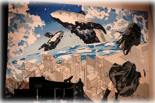
R7須賀野祭ステージバック(美術部制作)