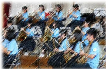
ステージ発表（吹奏楽部）