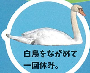
白鳥をながめて 一回休み。