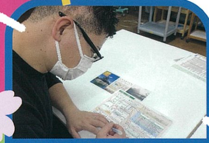
お出かけの計画は、ご本人とご家族の希望をお聞きしてから、午後の活動時間にあわせたプランを練っていきます。