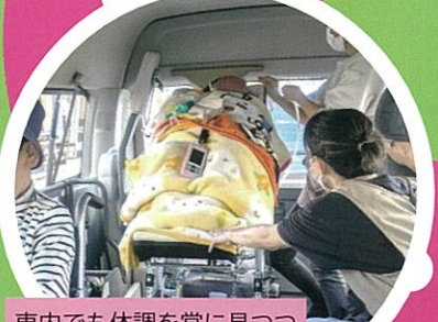
車内でも体調を常に見つつ 松本城へ向かいます。