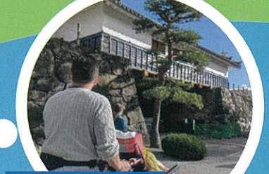
バス停に到着したら、 太鼓門から入城です。