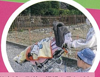
松本城に到着。埋橋を見ながら 天守閣へ向かいます。