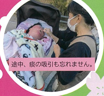
途中、痰の吸引も忘れません。