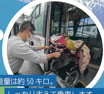
全重量は約50キロ。 しっかり支えて乗車します。