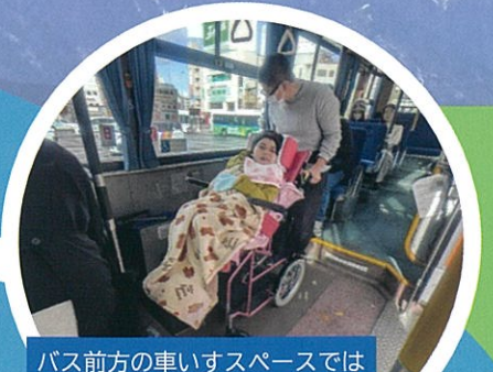
バス前方の車いすスペースでは 安全に乗車することができます。