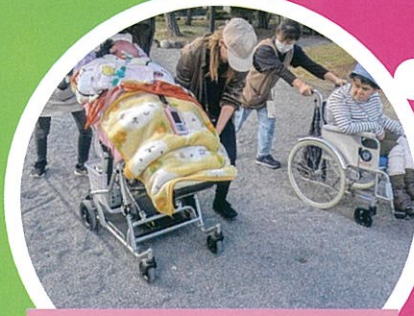
城内の砂利に車輪がめりこみますが、 支援員のパワーでのりきります。