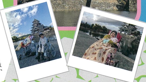
ちょっとした段差を 無事越えました。