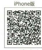
iPhone版 ごみ分別アプリ