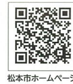
松本市ホームページ