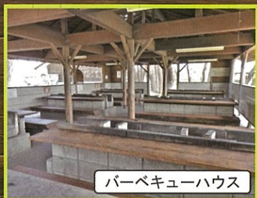
バーベキューハウス