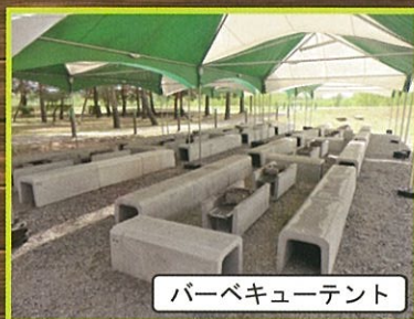
バーベキューテント