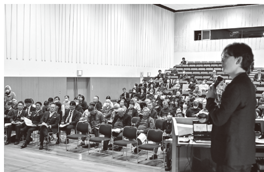
視聴者の反応に合わせて

現実です。大きな声に同調したり、「木を見て森を見ない」のも人の性、まして第4次産業革命といわれる昨今、AIに依存し考えることを放棄する人間が「ふつう」という時代に急速に変わっています。