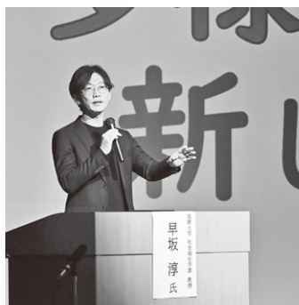
熱のこもった講演