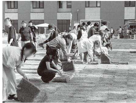
思いを込めて芝植え

12月19日にはキャンドルナイトイベントを開催し、災害時に活躍が期待されるキッチンカーの出店や野外生活のワークショップなどを通して、環境や防災について楽しく学べる機会を作りました。