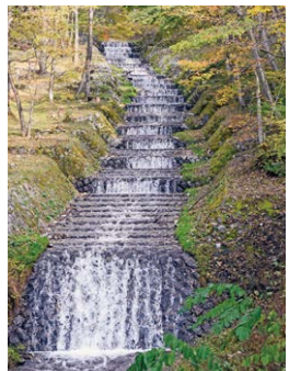
フランス式階段工

る途中、経典を運んでいた2頭の牛がそこで倒れたことか ら名が付いたと言われています。 フランス式階段工で知られる牛伏川や、牛伏ダムにもその名が付きました。