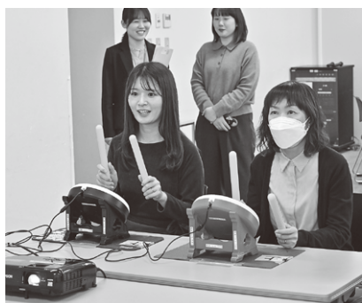
段々上手く打てるように

また高齢化が著しい浅間温泉への移住を促進する、合同会社 SunSun（すむすむ）は、移住者がシェアハウスを拠点に「住むから住民交流へ」ゆっくり展開していく好例でした。笑顔とおしゃべりが本領の和田地区健康マージャンや、eスポーツで世代交流する内田地区なども、楽しく遊ぶ地域づくりの知恵でした。