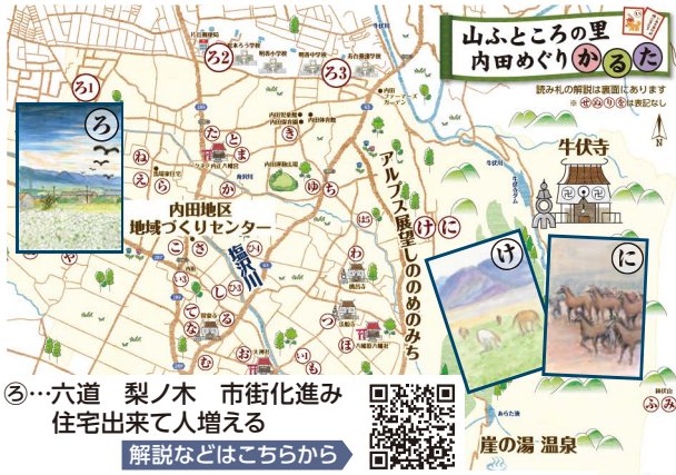
注：本図は「山ふところの里 内田めぐりかるた」を編集

信州随一とうたわれ る厄除け観音「牛伏寺」 には、寺名の由来があ ります。天平勝宝7(ア 56)年、唐からもた らされた大般若経60 0巻を善光寺へ奉納す