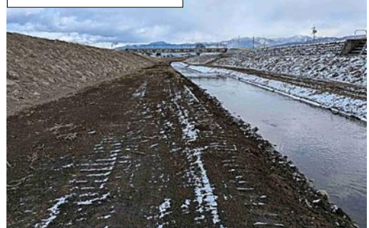
整備後の三間沢川

こうした中、今年1月には河川管理者である松本建設事務所による整備が行われました。これらの状況を踏まえ、神林地区から会の在り方を見直したいとの申し入れがあり、両地区の役員会および臨時総会において協議した結果、本年度をもって活動に区切りをつけることが承認されました。今後は両地区町会長会が河川の見守りや管理者への要望を担います。