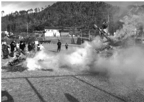
延期して実施された稲倉の三九郎

発表中は、たき火等の火の使用が制限される。林野火災注意報は罰則なしの努力義務だが、火災警報は違反すると30万円以下の罰金又は拘留の罰則が消防法で定められている。(松本市ホームページより)