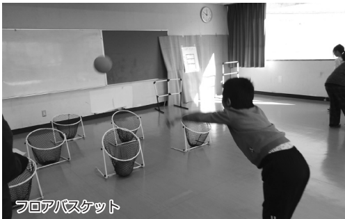
フロアバスケット

1月31日(土)に本郷公民館にて室内レクリエーションスポーツ体験会が行われました。ゲートボールのようなスティックでボールを打ち、点数の書かれた穴へと落とすスクットボール、マジックテープのついたダーツやボールを的に投げるソフトダーツ、床に設置したゴールにボールを投げ入れるフロアバスケット 当日は小学生を中心に約20名が競技サポーターの方から指導を受けながらゲームを楽しみました。(浅間6 T)