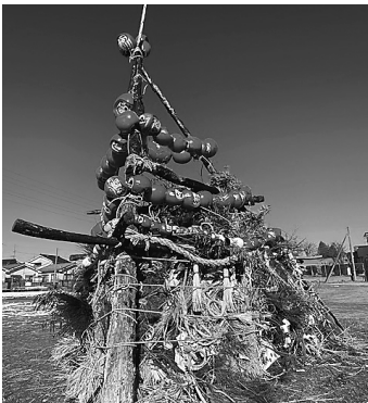
点火されず解体・撤去された三九郎

横田第1町会の小学生と保護者、子ども会役員さんが三角公園に集合し、数班に分散して玄関先に置かれたダルマや松飾り、しめ縄などを見落とさないように注意しながら町内を回り収集場所に運びました。三九郎開催場所の横田グラウンドには、育成会長さんが車で一気に運搬してくださり、松集めを終えた子ども