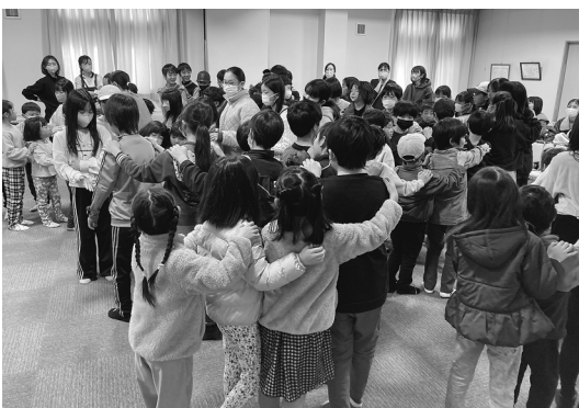
じゃんけん列車を楽しむ子どもたち

新1年生には黄色いカサを贈られ、「安心して学校に通ってね」と声をかけられていました。ビンゴ大会やじゃんけん列車などのレクリエーションも行われ、楽しそうな声が響いていました。(惣社 F)