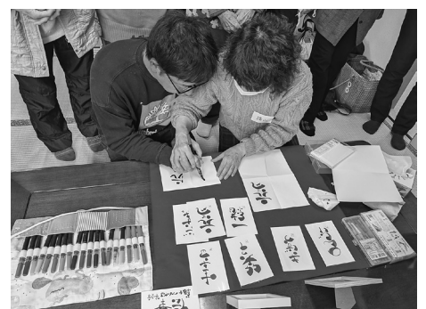
講師の指導で絵手紙を作る参加者

できないので、貴重な機会となりました。 会の後半では講師の指導による「絵手紙の実習講演会」がありました。自分の書きたい言葉を絵手紙に込めて表す体験を通して、絵手紙の楽しさや面白さを味わうことができました。実演する人も見守る人も大いに盛り上がり、新しい楽しみを発見することができました。(浅間8 K)