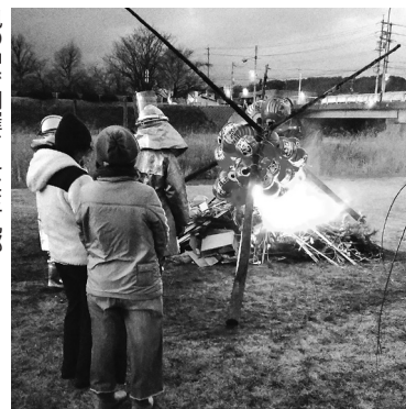
風の中で開催された三九郎

焼いた繭玉をフーフーしながらおいしそうに食べていました。強風と寒さの中で活躍された役員と消防の方々大変お疲れさまでした。(浅間6 T)