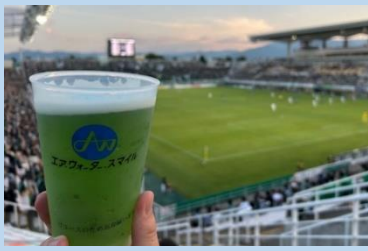
スポーツイベントで