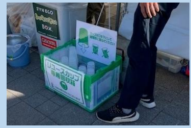
学校教育の一環として