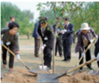
友好提携10周年を記念して人民公園に桜を植樹している様子(2005)