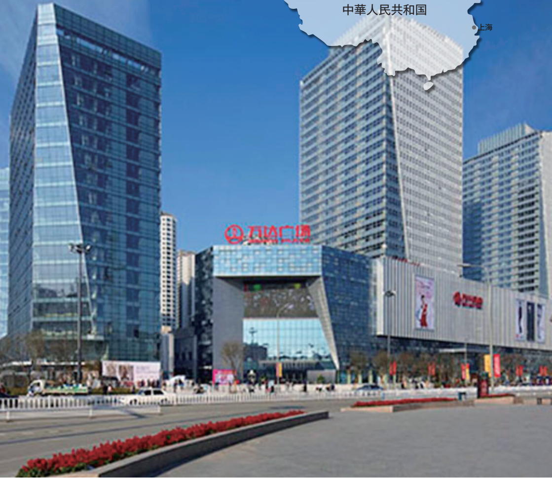
急速に発展する廊坊のまち