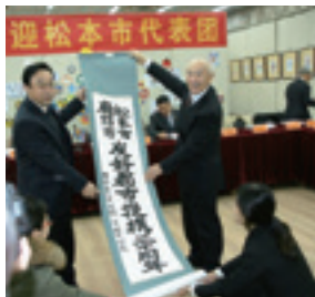
友好提携20周年を記念し、廊坊市第二中学校へ訪問(2015)