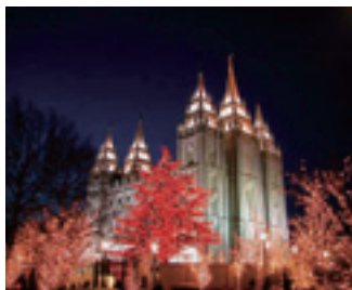
末日聖徒イエス・キリスト教会の神殿