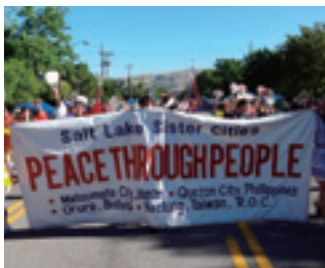
パイオニア(開拓者)パレード