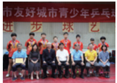
日中友好都市中学生卓球交歓大会(2019)