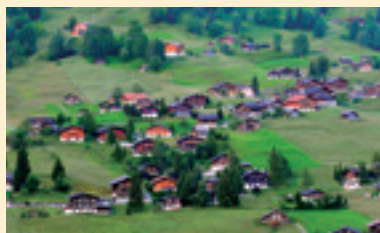
グリンデルワルト村