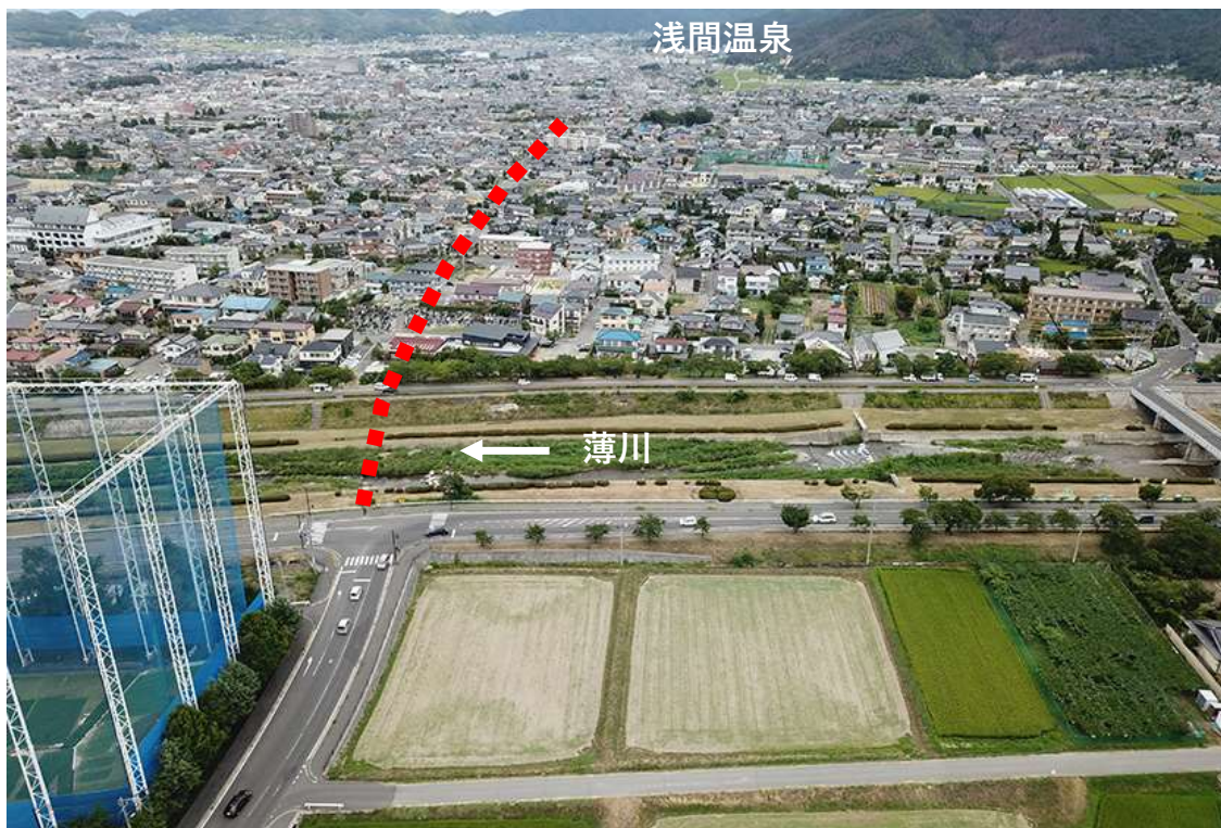
(里山辺南小松から浅間温泉方面を望む)