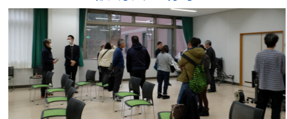
意見交換会では多岐に渡る質問が寄せられました