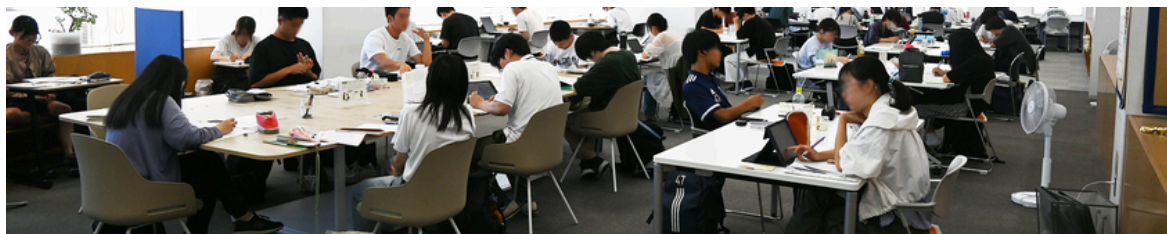
現在、7か所の地区公民館で実施されているフリースペースの様子

会議では、生涯学習課が地区公民館を若者の居場所として活用する取り組みを紹介しました。委員からは、公民館の利用に対する意識改革が必要との指摘があり、中学生の部活動を代替する高いハードルではなく、気軽に使える居場所としての利用を促すべきとの意見が出されました。また、公民館が若者の居場所となることに期待する声や、実際に中学生が集まる事例から可能性を感じたという意見もありました。これらを踏まえ、部活動に代わる新しい形の居場所づくりが展望されています。